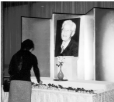
村野藤吾先生をしのぶ会・発会式より

(この一文は、「村野藤吾先生をしのぶ会」の発足に際して寄せられたものです。村野漾氏は平成十七年三月三日、ご逝去されました。享年七十歳でした。ご冥福を心よりお祈り申し上げます。)